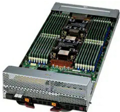
(Angled View – System)