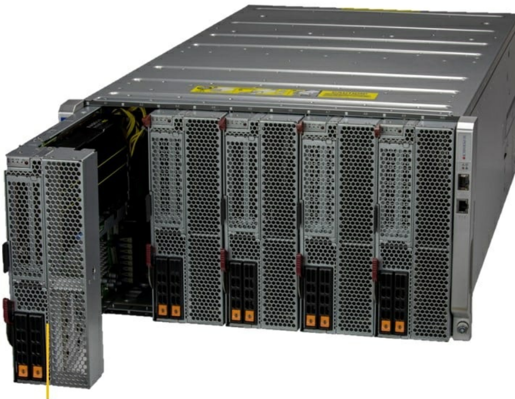
1 of 5 DP Blades

Отправьте запрос на коммерческое предложение SUPERMICRO и получите индивидуальные цены и сроки поставки. Серверы 1u, 2u, рабочие станции, системы хранения данных, серверные платформы, GPU-системы, BigTwin, SuperBlade