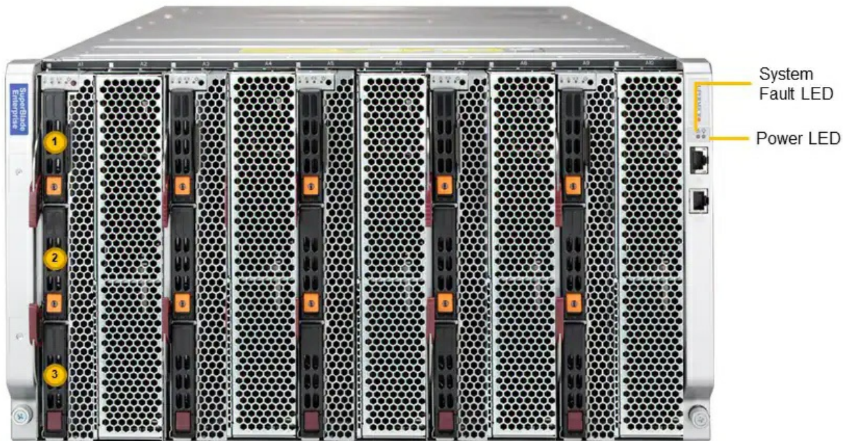
(Front View – System)

Тел: +7 499 110-81-61 | Email: sale@supermicro-russia.ru | https://supermicro-russia.ru