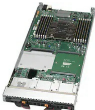
Фото Блейд-платформа Supermicro SBI-6419P-C3N

Тел: +7 499 110-81-61 | Email: sale@supermicro-russia.ru | https://supermicro-russia.ru