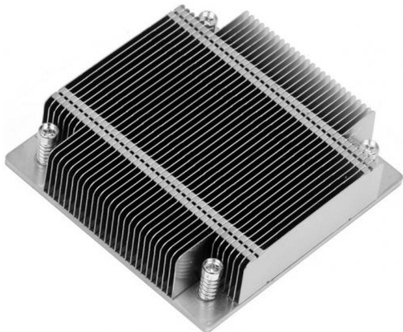
Фото Радиатор Supermicro SNK-P0046P пассивный

Тел: +7 499 110-81-61 | Email: sale@supermicro-russia.ru | https://supermicro-russia.ru