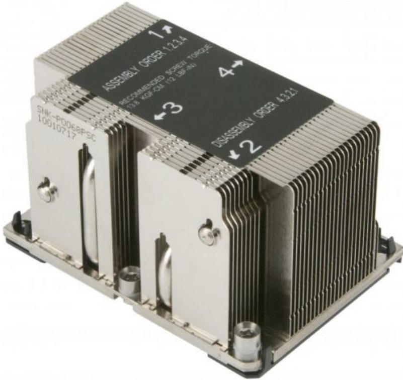
Фото Кулер Supermicro SNK-P0068PSC для LGA3647, 2U, пассивный

Тел: +7 499 110-81-61 | Email: sale@supermicro-russia.ru | https://supermicro-russia.ru