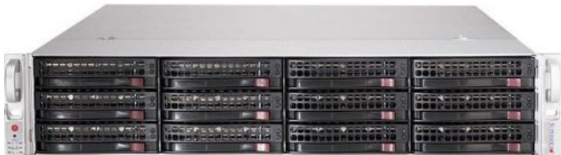
Фото Серверная платформа 2U Supermicro SSG-5029P-E1CTR12L

Тел: +7 499 110-81-61 | Email: sale@supermicro-russia.ru | https://supermicro-russia.ru