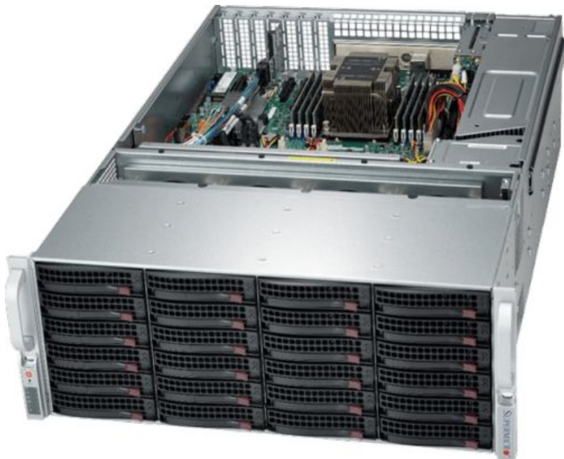
Фото Серверная платформа 4U Supermicro SSG-5049P-E1CTR36L

Тел: +7 499 110-81-61 | Email: sale@supermicro-russia.ru | https://supermicro-russia.ru