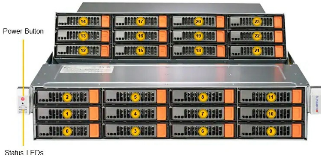
(Front View – System)

Тел: +7 499 110-81-61 | Email: sale@supermicro-russia.ru | https://supermicro-russia.ru