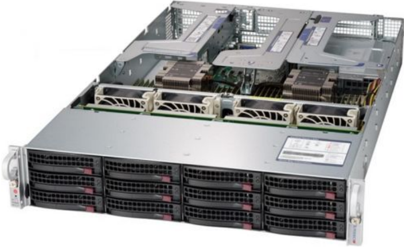
Фото Серверная платформа 2U Supermicro SSG-6029P-E1CR12H

Тел: +7 499 110-81-61 | Email: sale@supermicro-russia.ru | https://supermicro-russia.ru