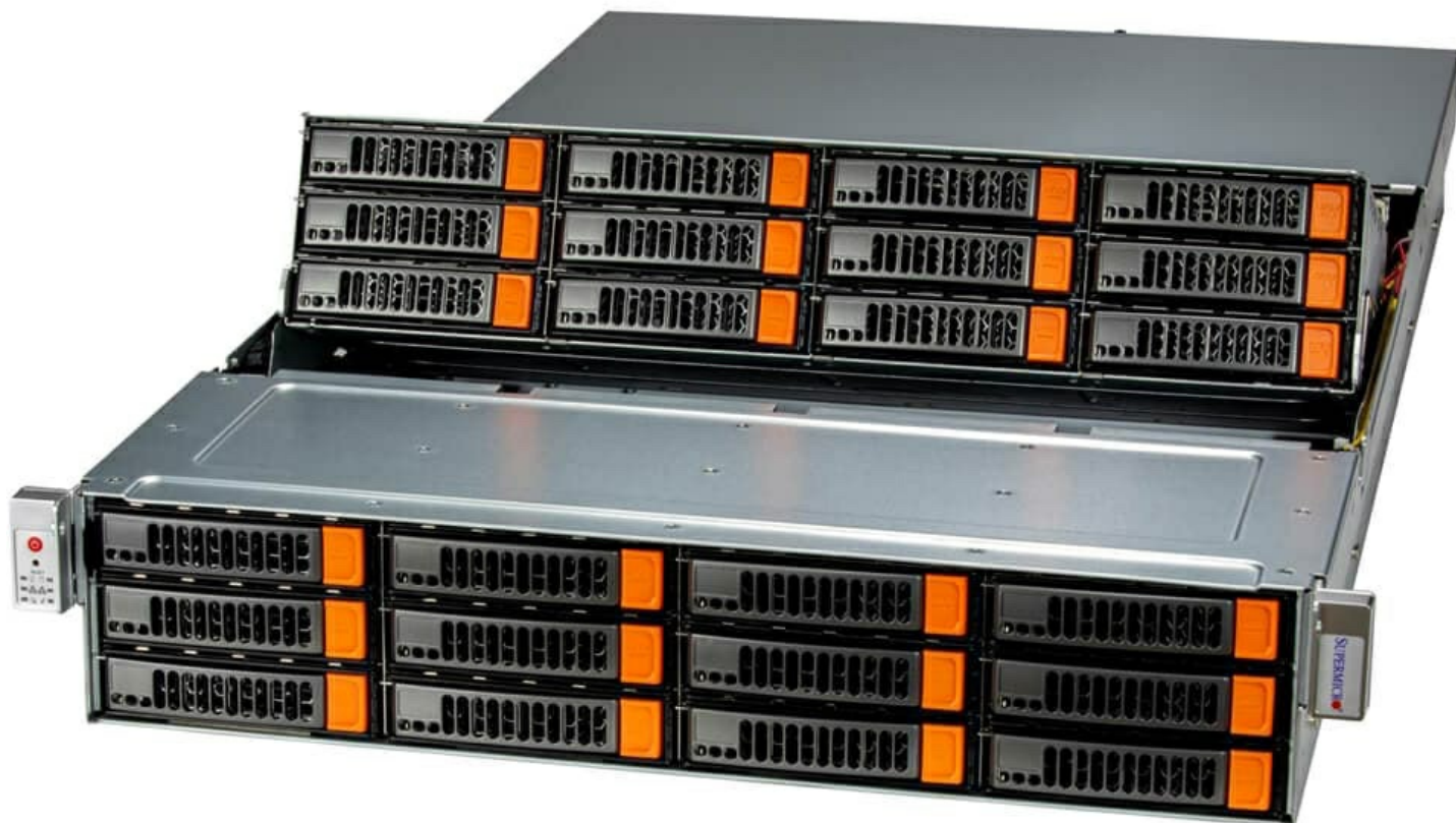
Фото Сервер хранения данных Supermicro SSG-620P-E1CR24L

Отправьте запрос на коммерческое предложение SUPERMICRO и получите индивидуальные цены и сроки поставки. Серверы 1u, 2u, рабочие станции, системы хранения данных, серверные платформы, GPU-системы, BigTwin, SuperBlade