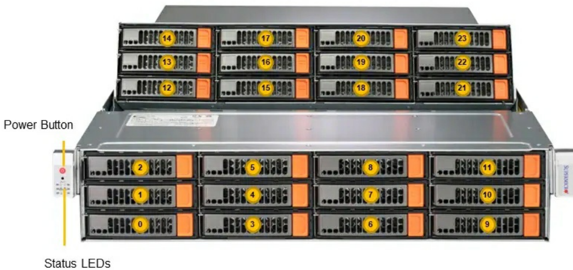
(Front View – System)

Тел: +7 499 110-81-61 | Email: sale@supermicro-russia.ru | https://supermicro-russia.ru