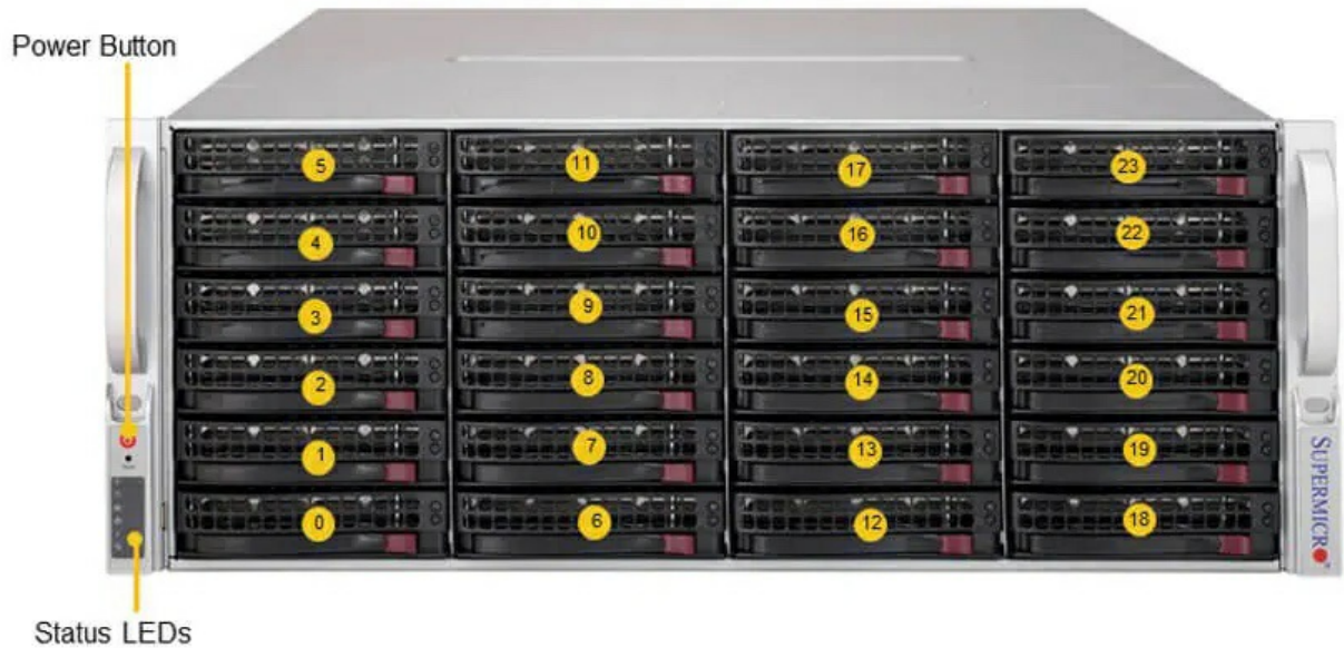
(Front View – System)

Тел: +7 499 110-81-61 | Email: sale@supermicro-russia.ru | https://supermicro-russia.ru