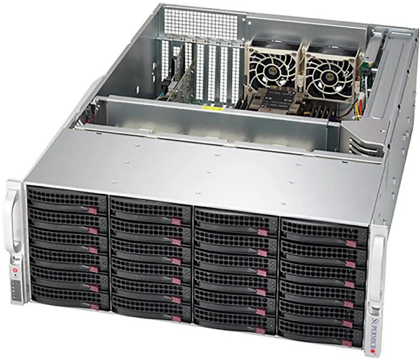
Фото Сервер хранения данных Supermicro SSG-640P-E1CR24L

Отправьте запрос на коммерческое предложение SUPERMICRO и получите индивидуальные цены и сроки поставки. Серверы 1u, 2u, рабочие станции, системы хранения данных, серверные платформы, GPU-системы, BigTwin, SuperBlade