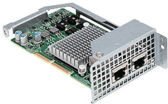
Фото Контроллер SuperMicro AOC-CTG-I2T

Отправьте запрос на коммерческое предложение SUPERMICRO и получите индивидуальные цены и сроки поставки. Серверы 1u, 2u, рабочие станции, системы хранения данных, серверные платформы, GPU-системы, BigTwin, SuperBlade