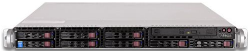
Фото Серверная платформа Supermicro SYS-1028R-MCTR 1U

Тел: +7 499 110-81-61 | Email: sale@supermicro-russia.ru | https://supermicro-russia.ru