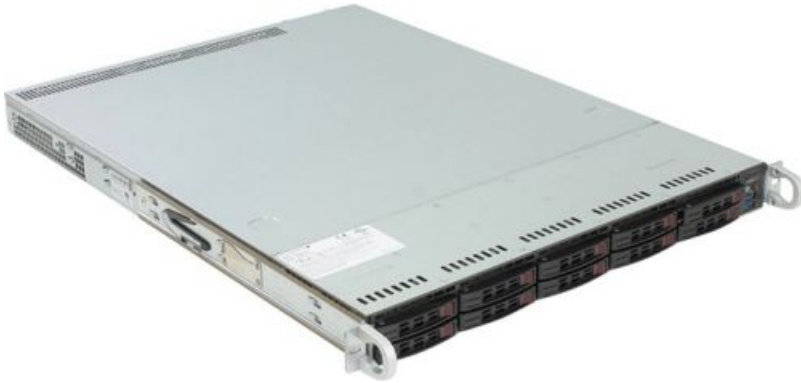
Фото Серверная платформа 1U Supermicro SYS-1028R-WC1R

Тел: +7 499 110-81-61 | Email: sale@supermicro-russia.ru | https://supermicro-russia.ru