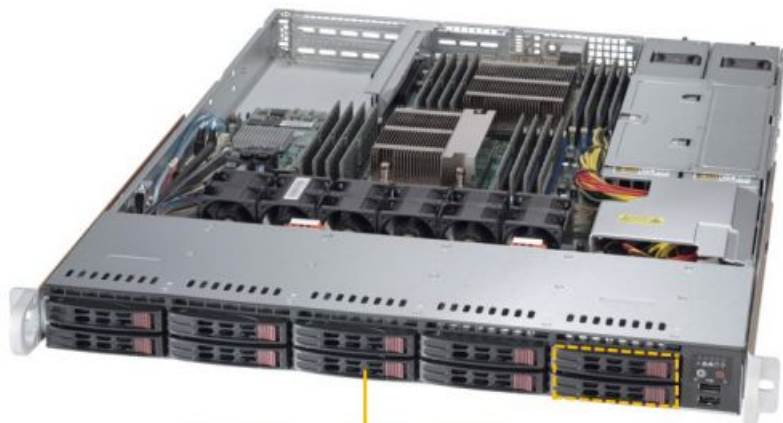
10x 2.5" Hot-swap SAS3/SATA3 Drive Bays (2x Hot-swap NVMe Drive Bays)

Тел: +7 499 110-81-61 | Email: sale@supermicro-russia.ru | https://supermicro-russia.ru