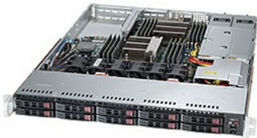
Фото Серверная платформа 1U Supermicro SYS-1028R-WTR

Тел: +7 499 110-81-61 | Email: sale@supermicro-russia.ru | https://supermicro-russia.ru