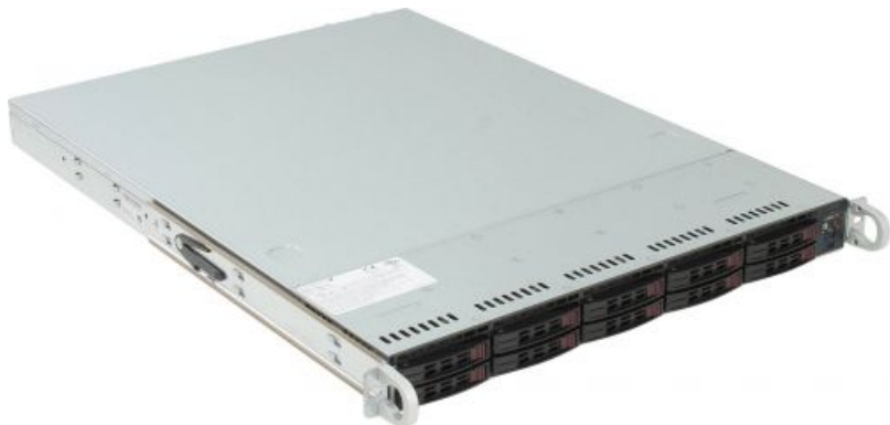
Фото Серверная платформа 1U Supermicro SYS-1028R-WTRT

Тел: +7 499 110-81-61 | Email: sale@supermicro-russia.ru | https://supermicro-russia.ru