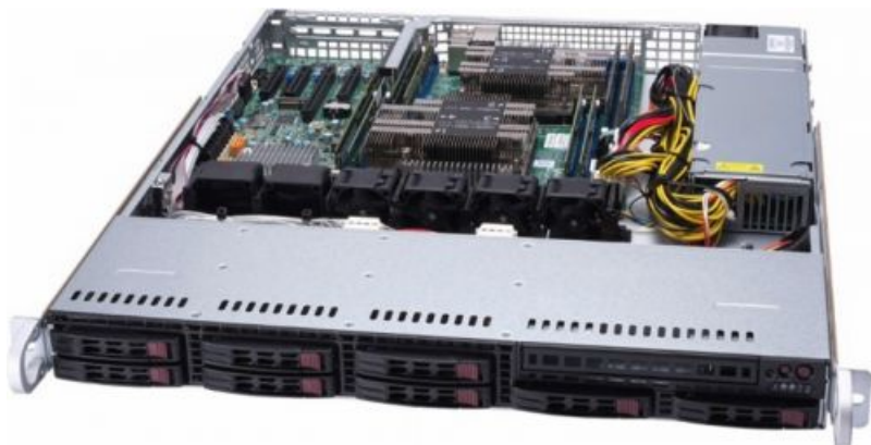
Фото Серверная платформа Supermicro SYS-1029P-MT 1U

Тел: +7 499 110-81-61 | Email: sale@supermicro-russia.ru | https://supermicro-russia.ru