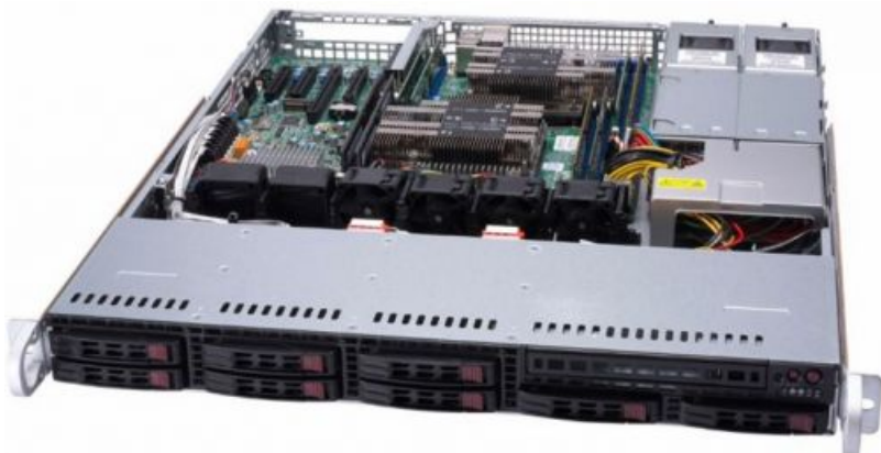
Фото Серверная платформа Supermicro SYS-1029P-MTR 1U

Тел: +7 499 110-81-61 | Email: sale@supermicro-russia.ru | https://supermicro-russia.ru