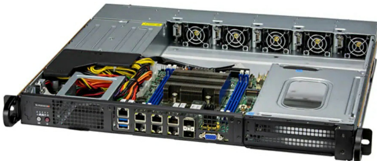
Фото Серверная платформа Supermicro SYS-110D-20C-FRDN8TP

Отправьте запрос на коммерческое предложение SUPERMICRO и получите индивидуальные цены и сроки поставки. Серверы 1u, 2u, рабочие станции, системы хранения данных, серверные платформы, GPU-системы, BigTwin, SuperBlade