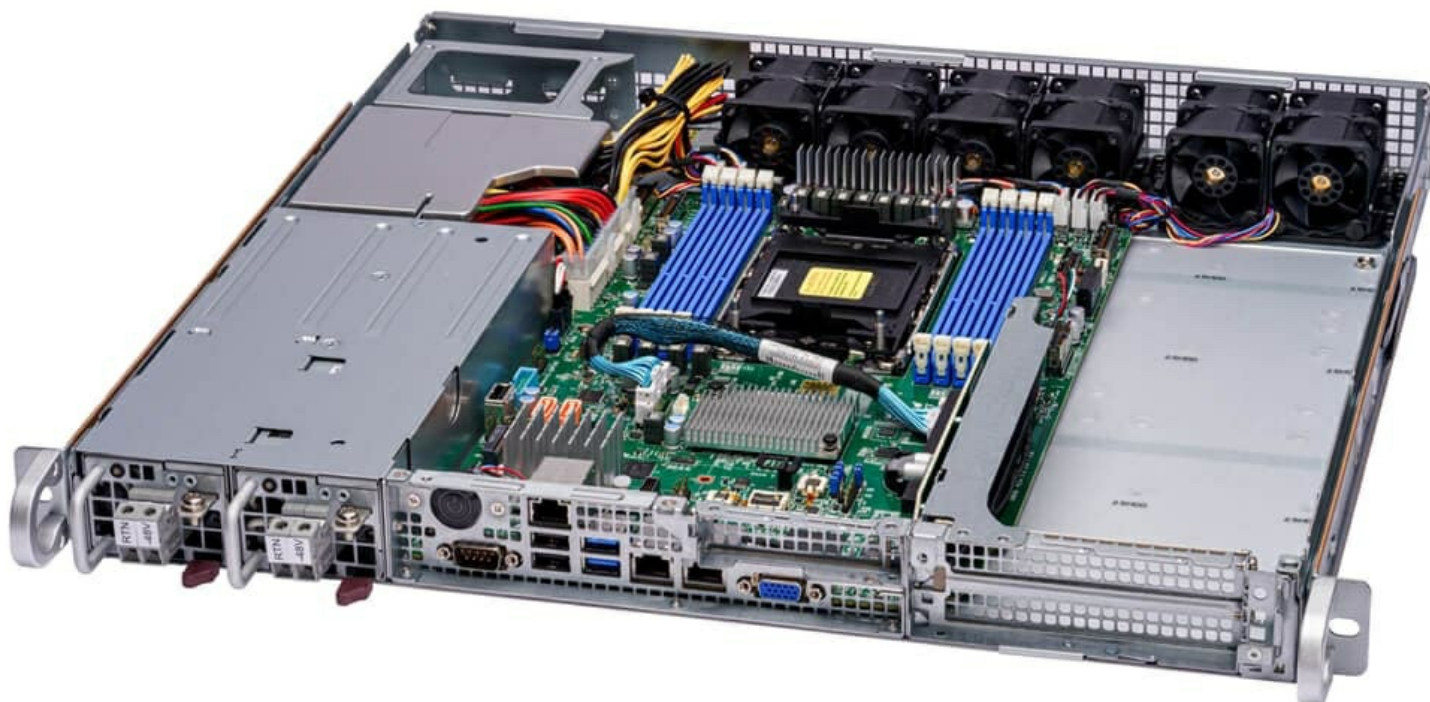
Фото Сервер Supermicro SYS-111E-FDWTR

Отправьте запрос на коммерческое предложение SUPERMICRO и получите индивидуальные цены и сроки поставки. Серверы 1u, 2u, рабочие станции, системы хранения данных, серверные платформы, GPU-системы, BigTwin, SuperBlade