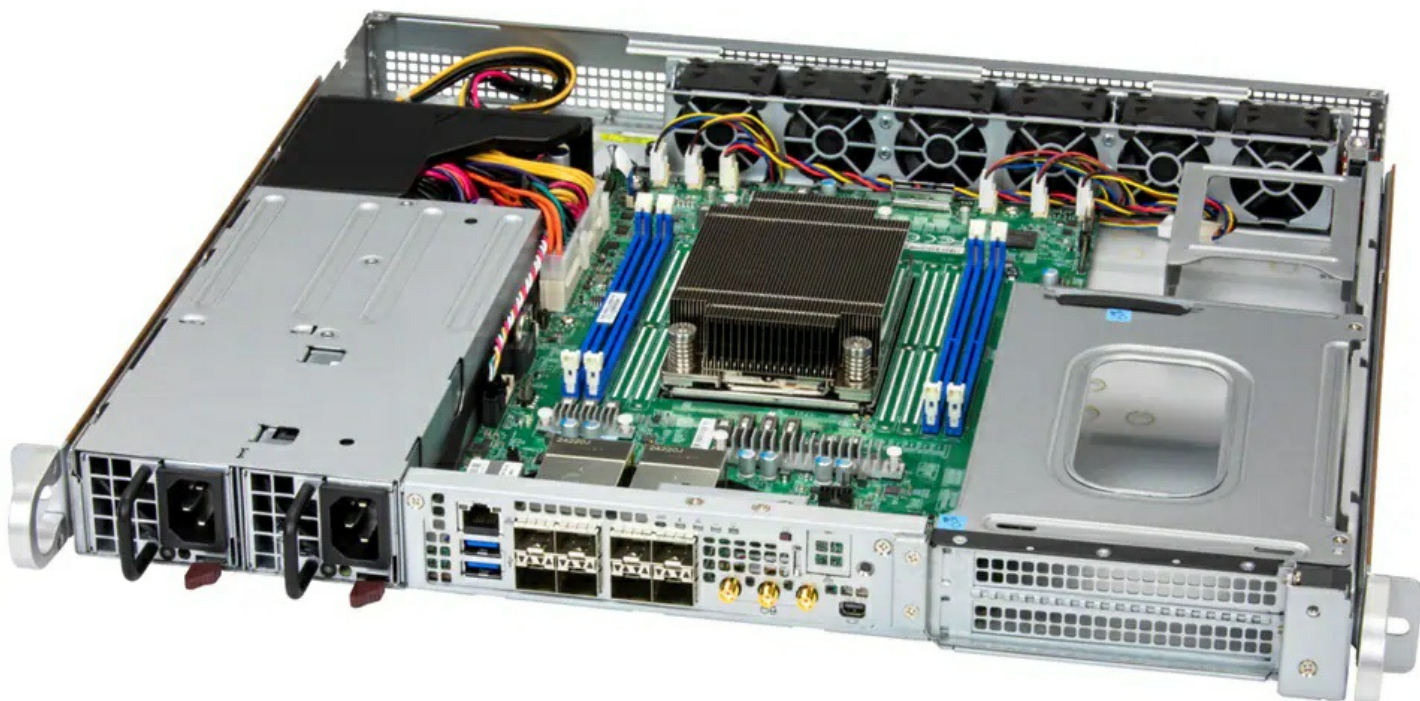
Фото 1U компактный телеком-краевой сервер Supermicro SYS-112D-42C-FN8P

Отправьте запрос на коммерческое предложение SUPERMICRO и получите индивидуальные цены и сроки поставки. Серверы 1u, 2u, рабочие станции, системы хранения данных, серверные платформы, GPU-системы, BigTwin, SuperBlade