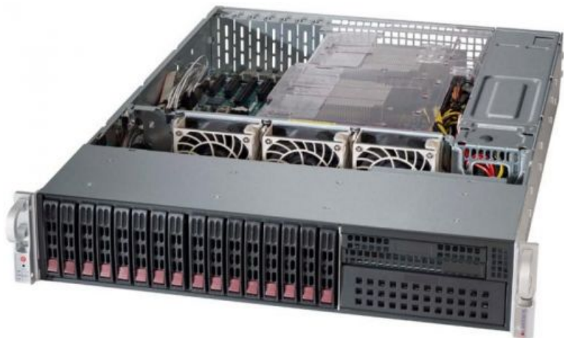
Фото Серверная платформа 2U Supermicro SYS-2028R-C1R

Тел: +7 499 110-81-61 | Email: sale@supermicro-russia.ru | https://supermicro-russia.ru