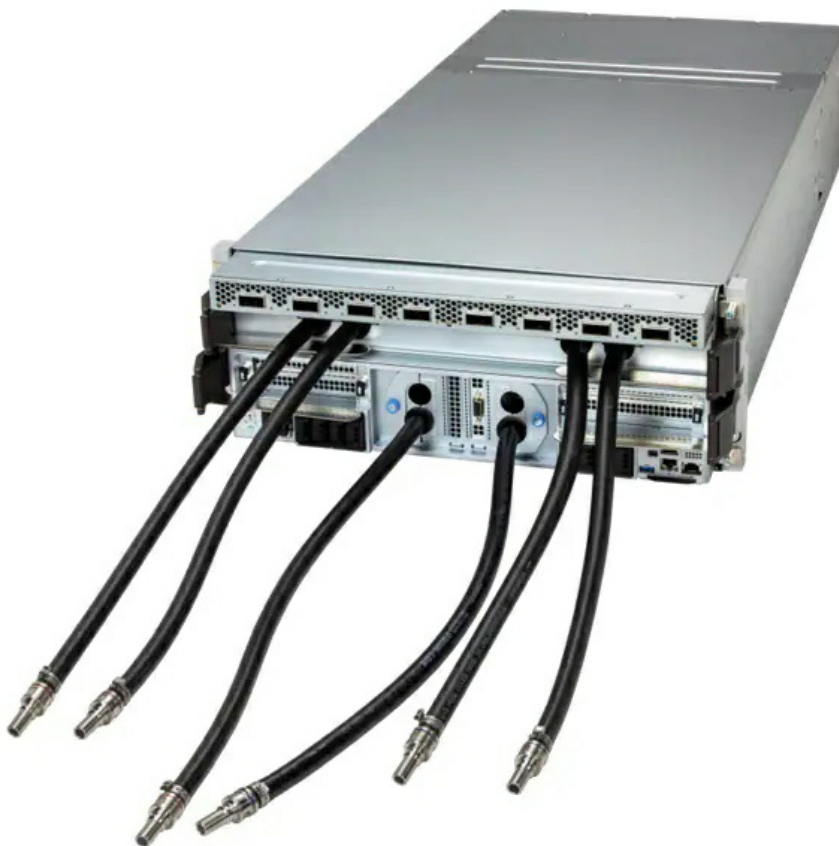
Фото Сервер Supermicro SYS-422GS-NB3RT-LCC

Отправьте запрос на коммерческое предложение SUPERMICRO и получите индивидуальные цены и сроки поставки. Серверы 1u, 2u, рабочие станции, системы хранения данных, серверные платформы, GPU-системы, BigTwin, SuperBlade