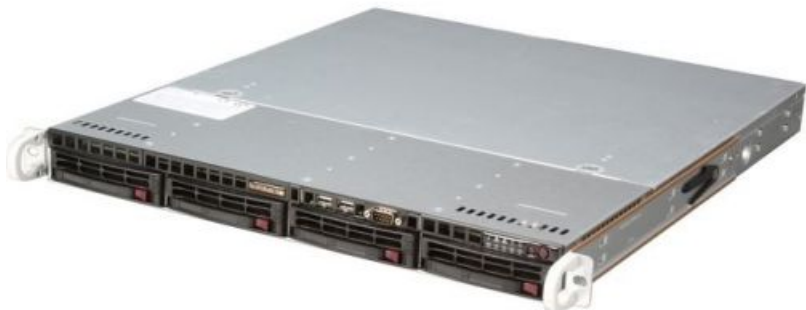
Фото Supermicro SYS-5018R-M серверная платформа 1U

Тел: +7 499 110-81-61 | Email: sale@supermicro-russia.ru | https://supermicro-russia.ru