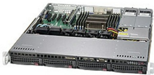
Фото Supermicro SYS-5018R-MR серверная платформа 1U

Тел: +7 499 110-81-61 | Email: sale@supermicro-russia.ru | https://supermicro-russia.ru