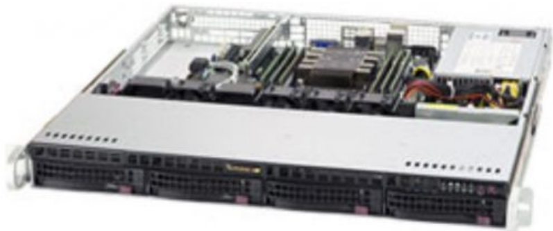
Фото Серверная платформа 1U Supermicro SYS-5019P-M

Тел: +7 499 110-81-61 | Email: sale@supermicro-russia.ru | https://supermicro-russia.ru