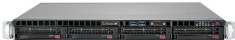
Фото Серверная платформа 1U SUPERMICRO SYS-5019P-MTR

Тел: +7 499 110-81-61 | Email: sale@supermicro-russia.ru | https://supermicro-russia.ru