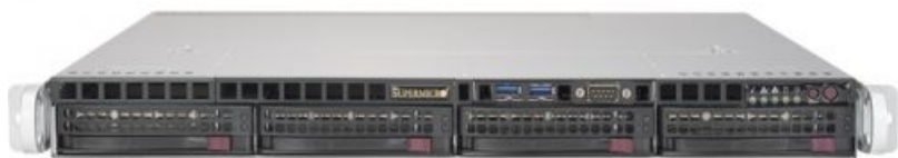
Фото Серверная платформа 1U Supermicro SYS-5019S-MR

Тел: +7 499 110-81-61 | Email: sale@supermicro-russia.ru | https://supermicro-russia.ru