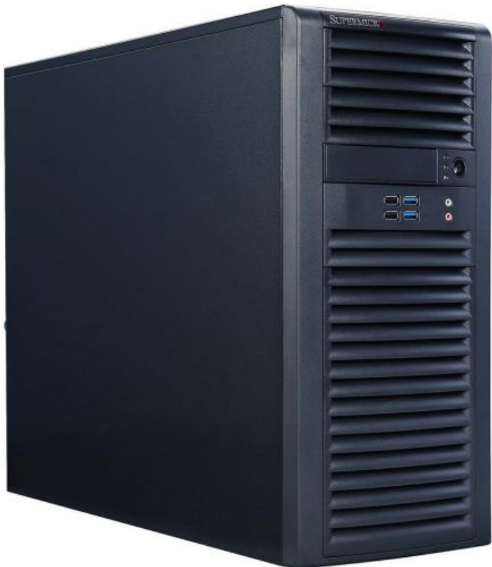
Фото Серверная платформа Supermicro SYS-5039A-IL

Отправьте запрос на коммерческое предложение SUPERMICRO и получите индивидуальные цены и сроки поставки. Серверы 1u, 2u, рабочие станции, системы хранения данных, серверные платформы, GPU-системы, BigTwin, SuperBlade