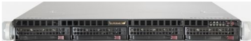
Фото Серверная платформа 1U Supermicro SYS-6018R-MTR

Тел: +7 499 110-81-61 | Email: sale@supermicro-russia.ru | https://supermicro-russia.ru