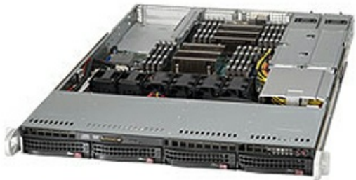
Фото Серверная платформа 1U Supermicro SYS-6018R-WTR

Тел: +7 499 110-81-61 | Email: sale@supermicro-russia.ru | https://supermicro-russia.ru