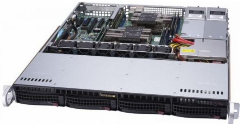
Фото Серверная платформа Supermicro SYS-6019P-MTR 1U

Тел: +7 499 110-81-61 | Email: sale@supermicro-russia.ru | https://supermicro-russia.ru