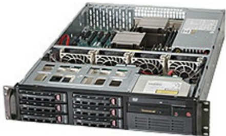
Фото Серверная платформа 2U Supermicro SYS-6028R-T

Тел: +7 499 110-81-61 | Email: sale@supermicro-russia.ru | https://supermicro-russia.ru