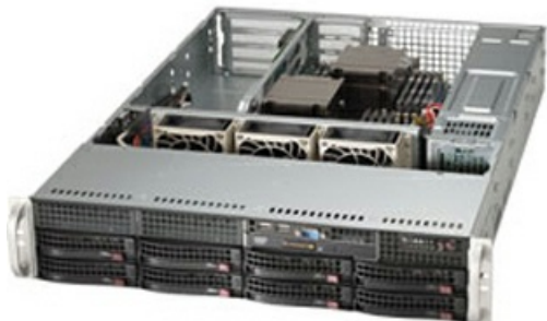
Фото Серверная платформа 2U Supermicro SYS-6028R-WTR

Тел: +7 499 110-81-61 | Email: sale@supermicro-russia.ru | https://supermicro-russia.ru