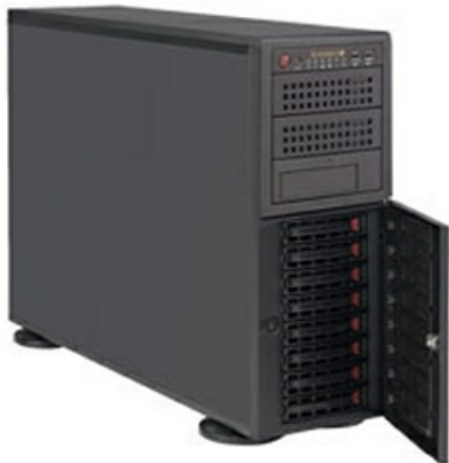
Фото Серверная платформа 4U Supermicro SYS-7048R-TR

Тел: +7 499 110-81-61 | Email: sale@supermicro-russia.ru | https://supermicro-russia.ru