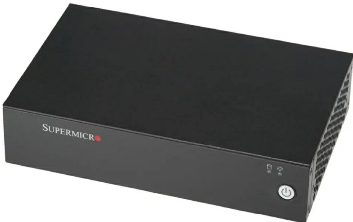
Фото Компактный встраиваемый Box PC Supermicro SYS-E102-13R-H

Отправьте запрос на коммерческое предложение SUPERMICRO и получите индивидуальные цены и сроки поставки. Серверы 1u, 2u, рабочие станции, системы хранения данных, серверные платформы, GPU-системы, BigTwin, SuperBlade