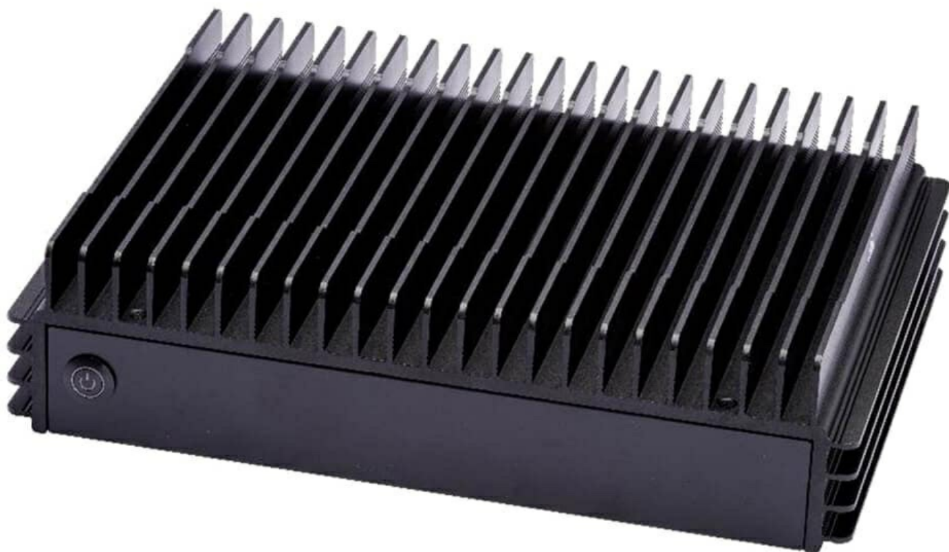
Фото Промышленный фанless Вох-сервер Supermicro SYS-E302-12D-8C

Отправьте запрос на коммерческое предложение SUPERMICRO и получите индивидуальные цены и сроки поставки. Серверы 1u, 2u, рабочие станции, системы хранения данных, серверные платформы, GPU-системы, BigTwin, SuperBlade