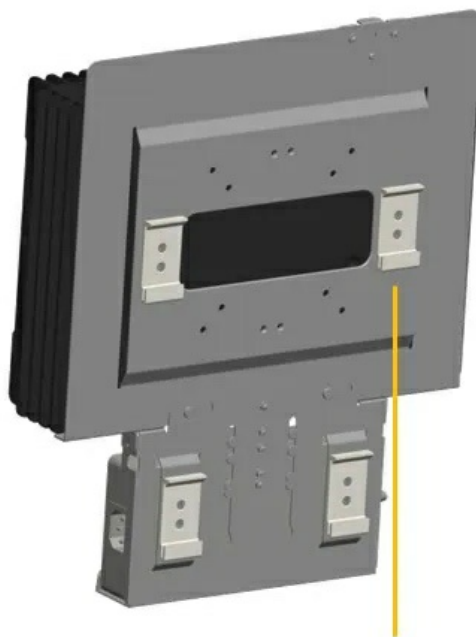
Wall/VESA Mount Bracket

Отправьте запрос на коммерческое предложение SUPERMICRO и получите индивидуальные цены и сроки поставки. Серверы 1u, 2u, рабочие станции, системы хранения данных, серверные платформы, GPU-системы, BigTwin, SuperBlade