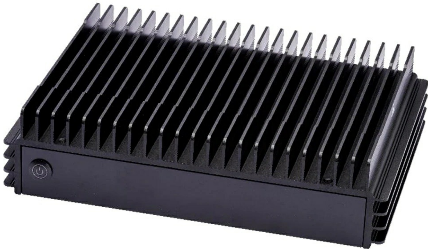
Фото Fanless Embedded система Supermicro SYS-E302-13AD

Отправьте запрос на коммерческое предложение SUPERMICRO и получите индивидуальные цены и сроки поставки. Серверы 1u, 2u, рабочие станции, системы хранения данных, серверные платформы, GPU-системы, BigTwin, SuperBlade