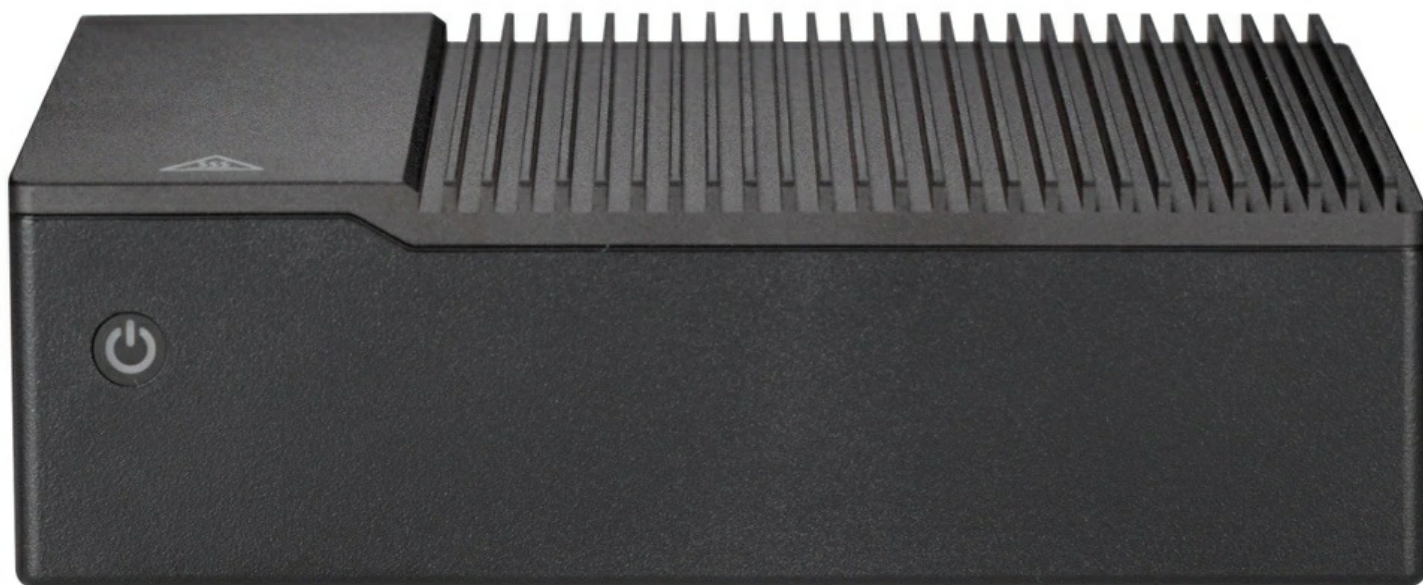
Фото Fanless embedded система Supermicro SYS-E50-14AM-L

Отправьте запрос на коммерческое предложение SUPERMICRO и получите индивидуальные цены и сроки поставки. Серверы 1u, 2u, рабочие станции, системы хранения данных, серверные платформы, GPU-системы, BigTwin, SuperBlade